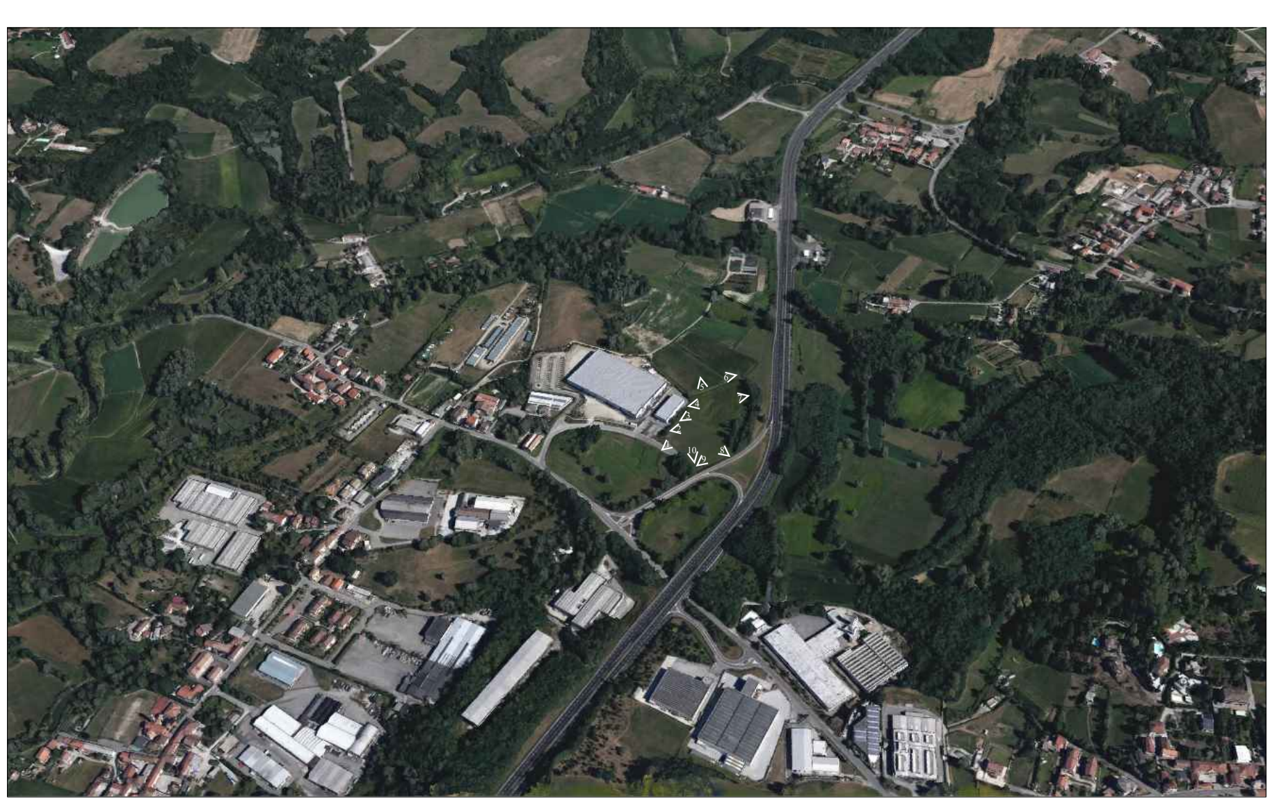
ORTOFOTO CON INDICATE PRESE FOTOGRAFICHE

LEGENDA PERIMETRO AREA OGGETTO DI PIANO ATTUATIVO